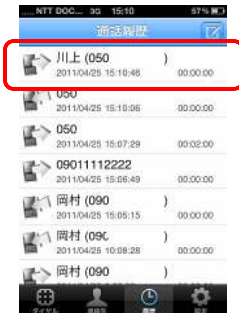
— 通話履歴画面 —